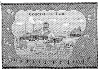
工芸 「カーニバルフェア」多中 央子