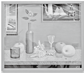
絵画 「絵画のある静物」高橋 渉