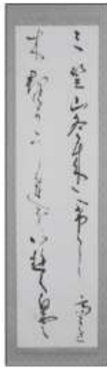
◀議長賞「北原白秋の和歌」 岸本 三朗