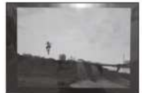
▲市長賞「夕焼と若者」 上念 喬