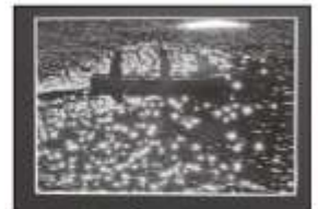
▲議長賞「輝の中を」 中西 春男