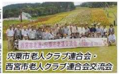
宍粟市老人クラブ連合会・西宮市老人クラブ連合会交流会

七月十六日、西宮市老連と宍粟市老連との交流会が宍粟市で行われました。老人福祉センターに集合の校区会長、役員ら総勢三十一名は午前八時三十分、「ことぶき号」バスで出発。中国自動車道の山崎ICから福保川沿いにうっそうと茂る杉、ヒノキ林の山間を縫うこと約一時間で「ちくさ高原ゆり園」に到着し、宍粟市