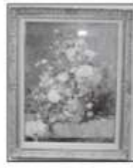
◀社会福祉協議会理事長賞 「春の花」 井上さくら代