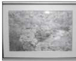
◀議長賞「紅葉」 井筒 哲幸