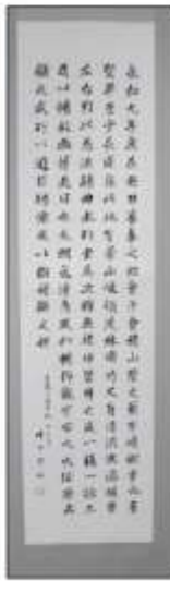
◀社会福祉協議会理事長賞「蘭亭叙論」 畔田 繁