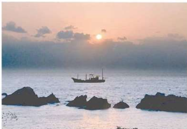
「和歌山県古座川町の日の出」

陽が昇り新しい年の幕開けを告げる 見なれた光景だが心ひきしまる 今の世は時折公式にない異変に見舞われるが 人々は試練と受けとめ きびしい自然をくぐり抜けて生きてきた 肩書き社会から解放されて時が経ったが 年経るのみの達人では効かない シニア時代の生き方を模索するに ひたむきな情熱をもって生きることは アンチエイジングへの序曲と考え 日々平穏をと念じつつ仲間と共に 今日を生きよう