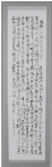
◀市長賞「張抱一公祖 王鐸」 奥田 忠蔵