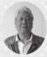
西宮いきいき体操をはじめ

小松校区で実施するための検討をし、まず介護予防サポーター養成講座を九名の会員が受講しました。会場確保に時間がかかりましたが、平成二十六年二月にスタートすることになりました。