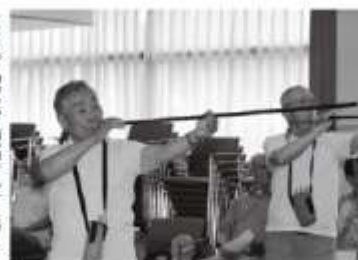
午前、午後とも優勝から