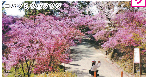
コバノミツバツツジ

大きな行事「ことぶきバス」。この1、2年コロナ禍で厳しい歳月が流れましたが、バスは古都奈良方面へ向かいました。みんな大好き「イチゴ狩り」、そして欠かせないのが「道の駅」です。買うものは決まっています。新鮮な野菜、果物、少々重くても気になります。それよりも午前中に道の駅へ行くこと、これが一番です。次に行く先は待望の「イチゴ狩り」です。自分の手で摘んで味わうその味は格別です。自分の腹と相談もななく入るだけ思う存分「余は満足じゃ」の世界です。