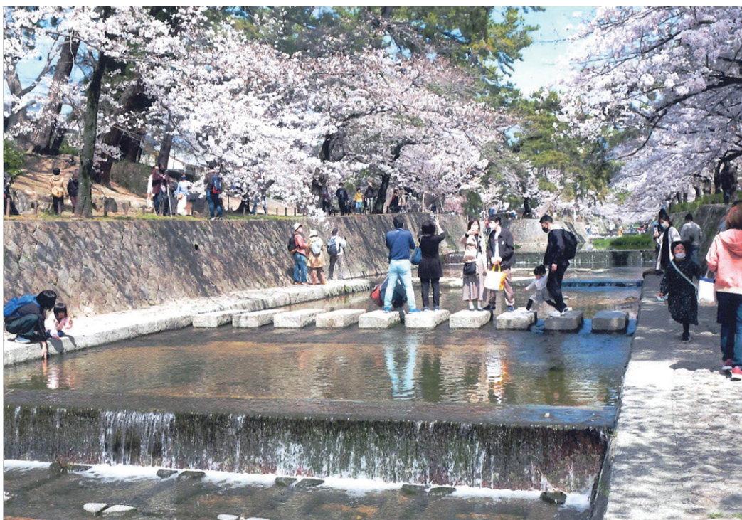
「夙川の桜」 写真と文 田中 積氏 (用海校区)

4キロに及ぶ堤防に1660本の桜が植えられ、日本の桜百選に選ばれている。昭和40年に市花に選定、市民に親しまれてきた季節は春、草木が芽を吹き、躍動感に溢れている。入学、進級、諸行事は新年度を迎え、私達も何か未来に向かって挑戦してみたい心地となる。