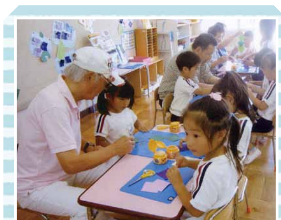
子どもたちと楽しい時間を過ごしました

行われていた環境の中で、叱られ・教えられ・学んで育ってきました。これからはこの貴重な経験を