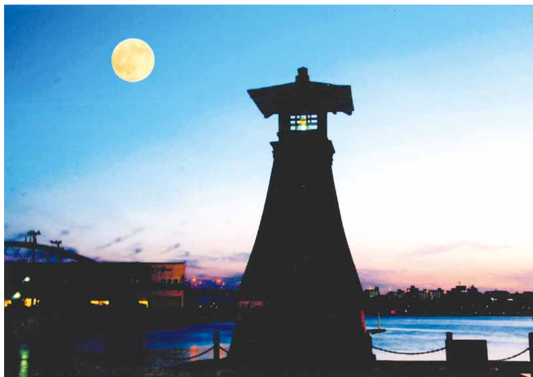
今津灯台と月 写真と文 田中 積氏 (用海校区)

虫の声と共に 秋の涼気が運ばれて来た 自然の優しさを感じながら すすきと団子を供え月を愛でる 風情をしばし楽しむ