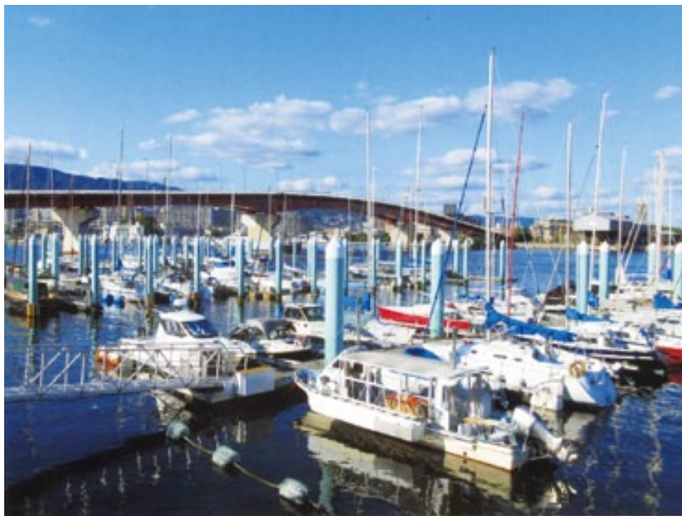
ヨットハーバーから西宮大橋をのぞむ 写真と文 田中 積氏 (用海校区)

爽やかな秋晴れと 水面に映えるマストの群れ 今年は秋時雨が長く 木枯らし 小春日和と繰り返し やがて冬を迎える