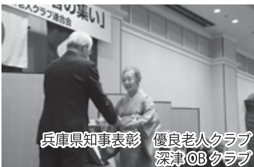
兵庫県知事表彰 優良老人クラブ 深津OBクラブ

揃いのはつび姿で高松公園の舞台を囲み、未来ある子どもと高齢者が輪になり手をつなぎ交流しました。