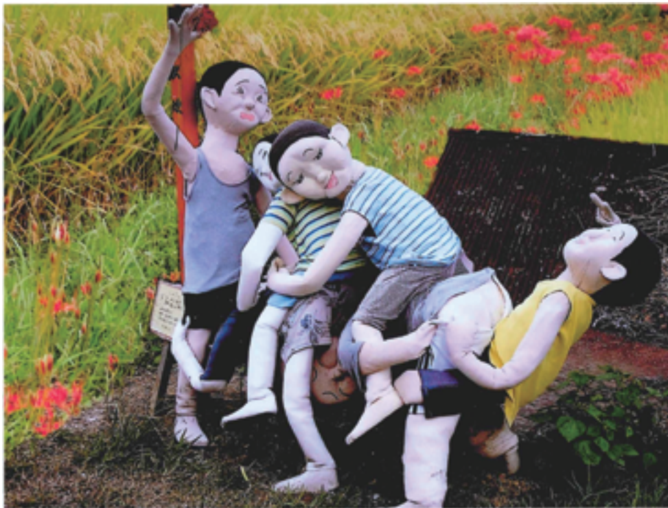
奈良 明日香村稲刈 写真と文 田中 積氏 (用海校区)

黄金色の稲穂が風に揺らぐ 実りの秋に感謝 間もなく収穫が始まる 案山子にも「お疲れさま」と 声をかけたい