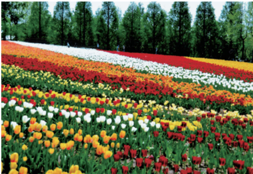
広島県世羅高原 チューリップ農園 写真と文 田中 積氏 (用海校区)

オランダの風車と共に紹介される事が多いチューリップ、原産地はトルコであるが オランダに伝わり日本に渡って来た。 チューリップの魅力は シンプルな可愛らしい形とカラフルな色合いにあるとおもう。