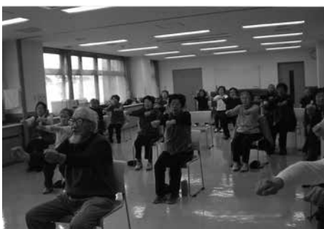
西宮いきいき体操