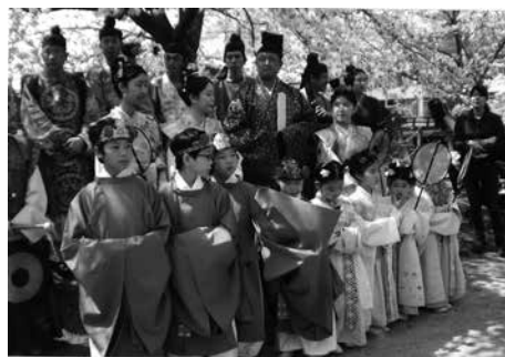
孝徳天皇行幸祭り