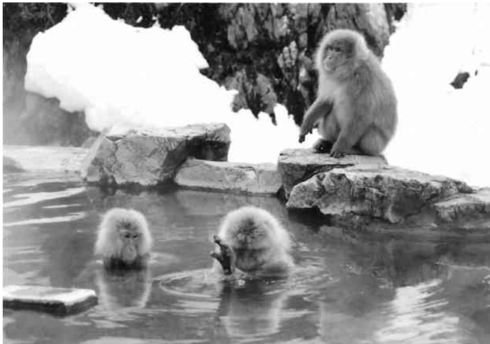
長野県志賀高原 地獄谷のサル