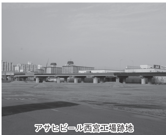
アサヒビール西宮工場跡地

静観するしかないものでしょうか。なお、私どもとしては他の施設の建設も視野に入れた計画を願いたいものであります。