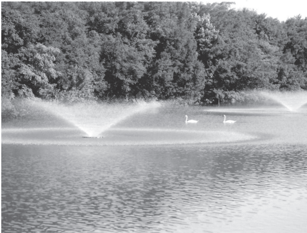
「明石公園」

気ままな気温変動のなか六甲の山にも春の兆しが… まだ衣をまといきれない雑木に混じり柳が揺れる 生命力の豊かさ故神木として古くより 雛の節句に供されたときく かすかな気配を感じとり蠢く生き物 里山は人々が温もりを感じる身近な自然 スカンポの花穂にベニシジミが群がるころ ホダ木に小さな傘が無数にひらく