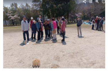
モルックのアトラクション