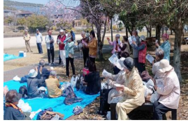
コーラス部の実演