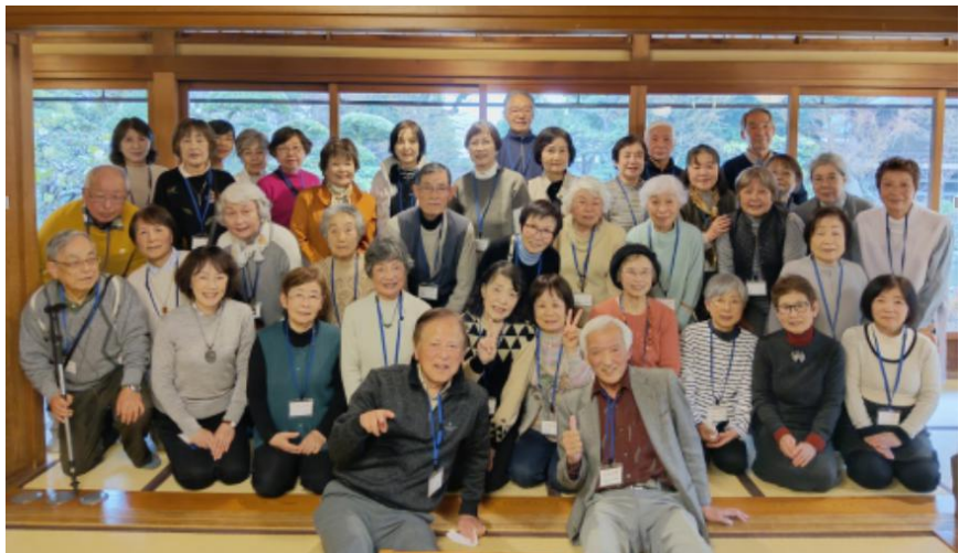
庭園をバックに大広間内で集合写真

食事後に庭園の散策を予定していましたが、あいにくの雨で部屋から庭園を鑑賞しました。そして最後に太平サブローのCMでおなじみのミルク饅頭月化粧の青木松風庵の工場見学に行きました。月化粧の工場では、全自動の工程を見ながら温かい美味しい月化粧饅頭を頂き、売店ではお土産を買い楽しい時間を過ごし帰路となりました。