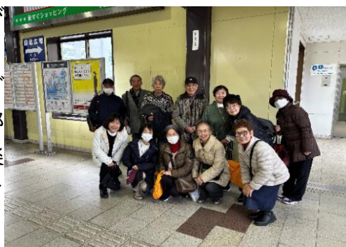
3/4みんなで一緒にお楽しみ会