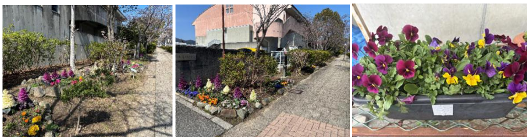
今年度における花壇の写真

冬の間成長するかどうか不安でした。しかし、春まで陽当たりの良いところで根気強く育てると綺麗に咲きました。