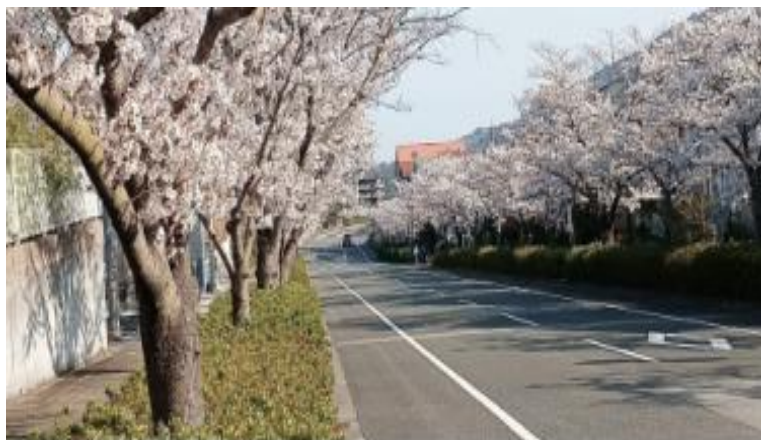
東山台桜通りの桜満開状況から生瀬方面を望む (2025.4.6.撮)