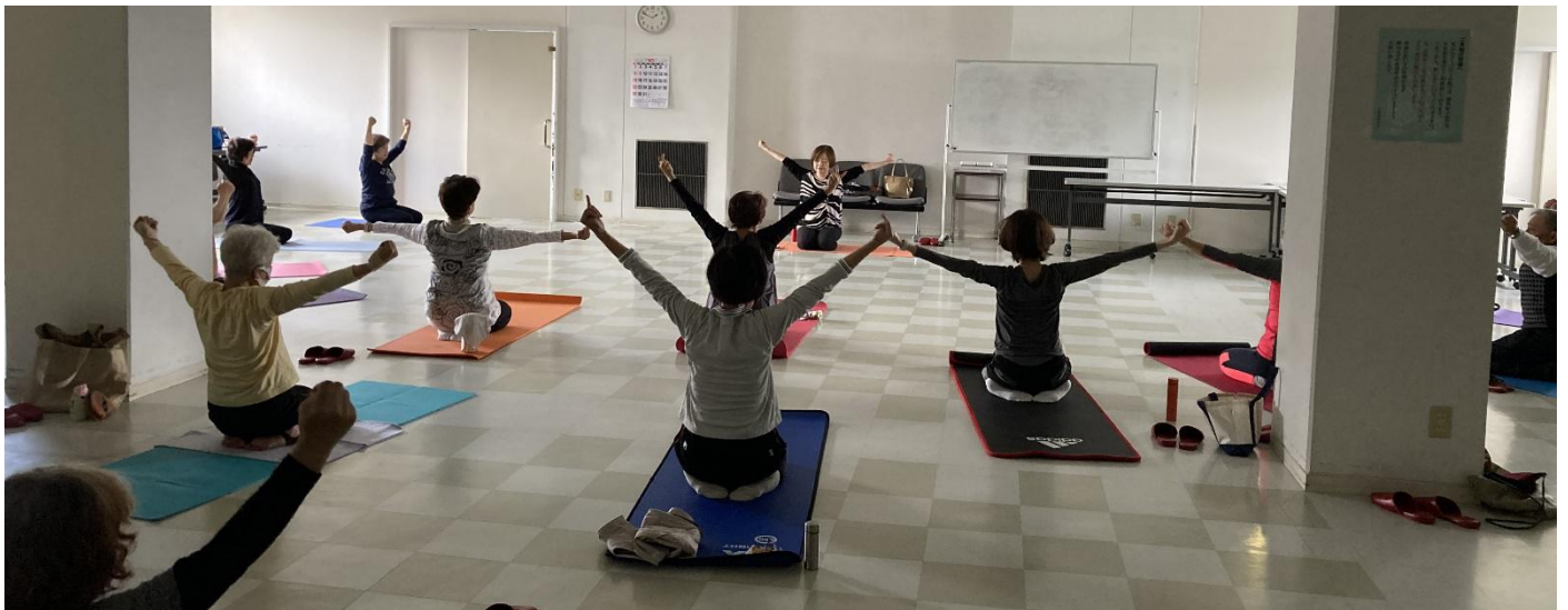
ヨーガ部活動状況

いまの世の中、朝目を覚ますとラジオ、テレビ、新聞そしてスマホがあり、朝食もそこそこ家に飛び出し、ゆっくりした時間を感じる事が少なくなっていると思います。現役をリタイヤした方でも同じです。人生100年今こそ自分の心とカラダを見つめ直してヨーガを楽しみましょう。