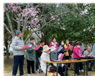
コーラス部の披露

お弁当を食べた後、自由に歓談となりましたが、あまりの寒さに会は早めのお開きとなりました。その後例年のようにグラウンド・ゴルフや輪投げに興じる方も見受けられました。こんなお天気でしたが、1年に1回のこの日に久しぶりに会い、にこやかに談笑する皆様の姿にほっこりさせられます。