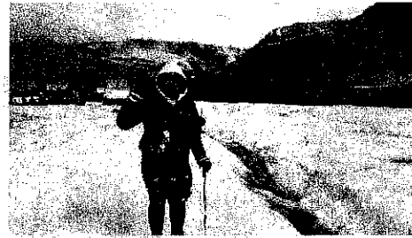
氷河の上 (溝・バスエリア)