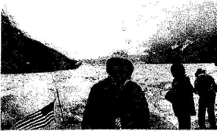
氷河の上 (奥はみぞれ雲)