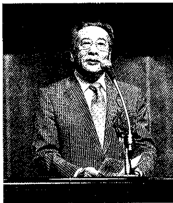
▲加藤県議会議長祝辞